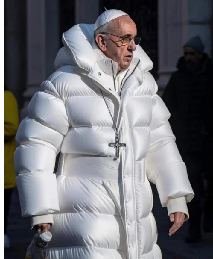
Deepfake : le pape François (2023)

Pour se toucher en revanche, il faut bien être physiquement présent dans un même lieu, au même moment.