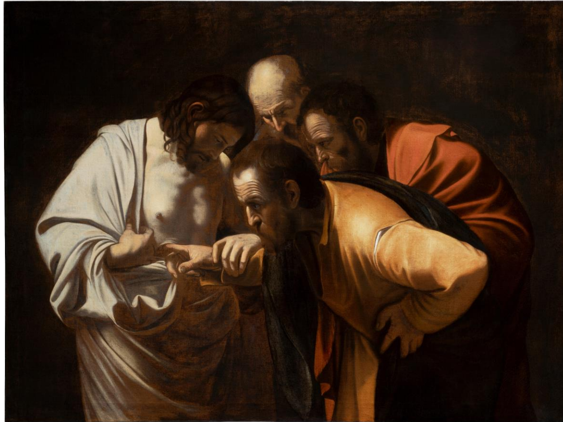
Le Caravage : l'incrédulité de saint Thomas (1601)