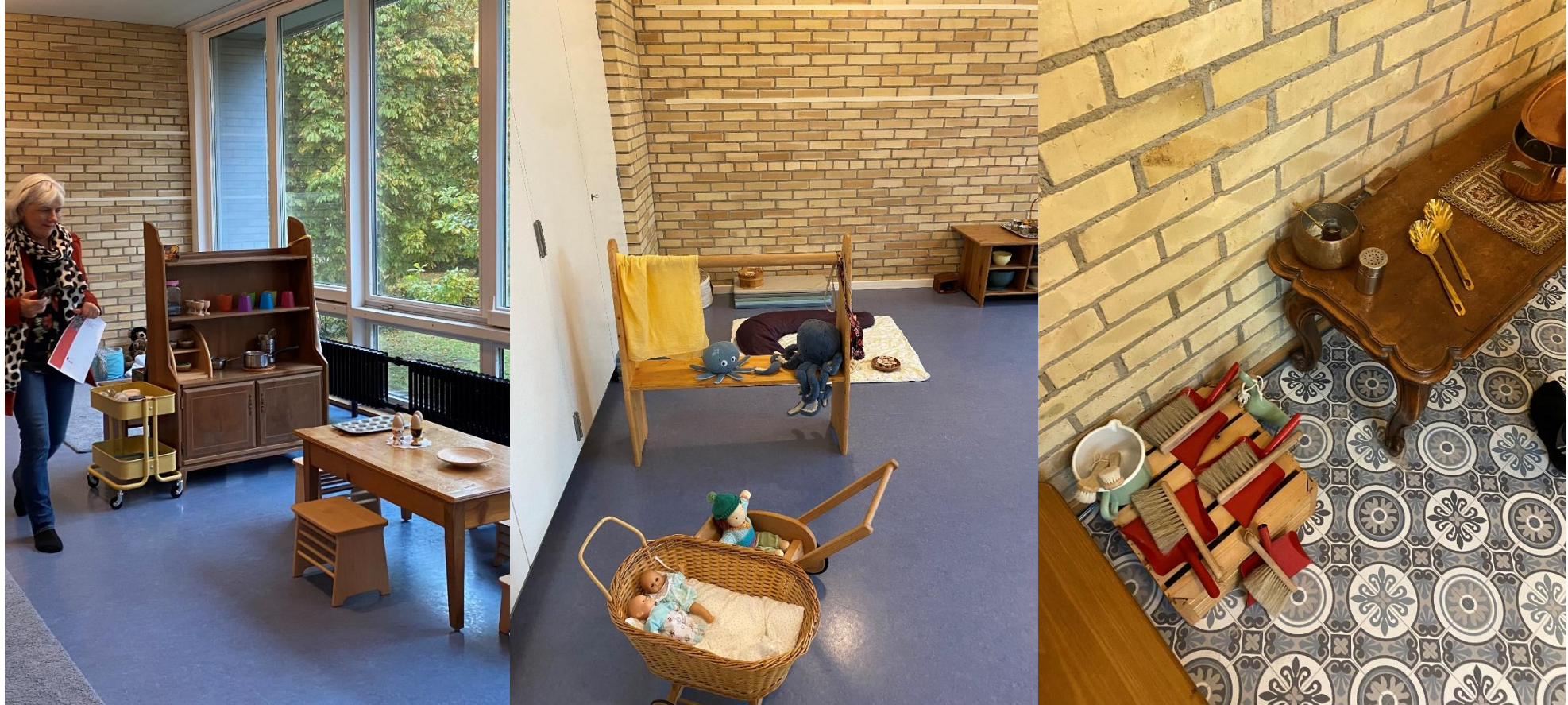
Eindrücke aus dem NLQ vor Ort 2023 in Aarau, Beispiel frühkindliche Förderung, Quartierentwicklung als Querschnittsaufgabe